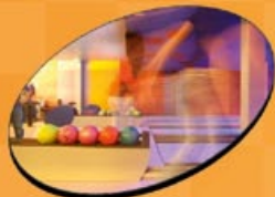
Bowling (5€ Partie)